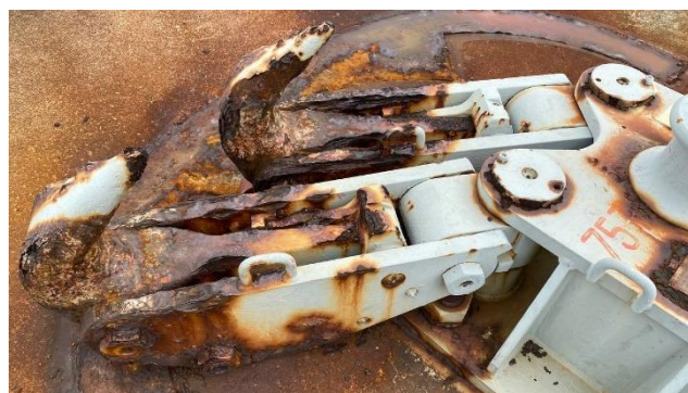
Фото зроблено до застосування ZINGA